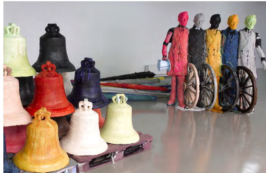
Bild: Ausschnitt aus einer Installation von Folkert de Jong: Infinite Silence; The way Things are and how they became Things, 2009, Office for Contemporary Art, Amsterdam.

5. bis 7. März 2010, Hochschule für Gestaltung, Karlsruhe